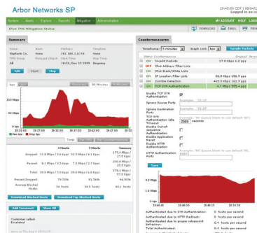
Panel de mitigación y alerta en tiempo real

La clave de la mitigación eficaz es la capacidad de identificar y bloquear el tráfico de ataque a la vez que permite que un tráfico sin ataques fluya hasta su destino previsto. Los ataques de DDoS a gran escala afectan no solo a la víctima intencional, sino también a otros clientes desafortunados que puedan estar utilizando el mismo servicio de red compartido. Para reducir este daño colateral, los proveedores de servicios y los proveedores de hosting a menudo cierran todo el tráfico destinado al sitio de la víctima, completando así el ataque DDoS. Ya sea un ataque de inundación de alto volumen diseñado para agotar la capacidad de ancho de banda o un ataque dirigido que busca derrocar un sitio web, en algunos casos, TMS puede aislar y eliminar el tráfico de ataque, sin afectar a otros usuarios, en tan solo algunos segundos. Los métodos incluyen la identificación y la inclusión en lista negra de los hosts maliciosos, la mitigación basada en la ubicación IP, filtro basado en anomalías en el protocolo, eliminación de paquete mal formado y limitación de velocidad (para manejar con gracia los picos de demanda no malintencionados). Las mitigaciones pueden ser automáticas o iniciadas por un operador y las medidas defensivas se pueden combinar para abordar ataques mixtos.